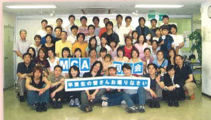
同窓会 / Class Reunion

Medical fee in Japan is expensive. If you are not covered by the insurance, it will cost more than ten thousand yen for one visit to a hospital for catching a cold, for instance. Insurance premium for one year is about 12,000 yen for Tokyo 23 wards residents. MCA fee at the enrollment includes ten thousand yen for the insurance policy.