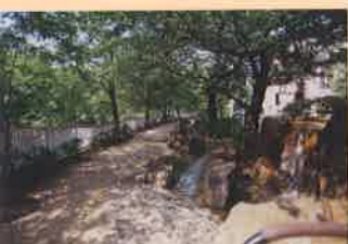
神田上水公園 / Kandaousui Park