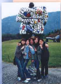
箱根彫刻の森美術館 Hakone Open-Air Museum