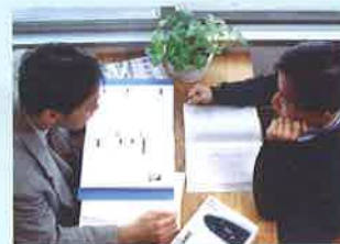
進学個別相談 Personal counseling session for further study

進学調査(第2回) 2nd Counseling session for students going to university/vocational school