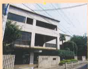
北新宿図書館 Kitashinjuku Library