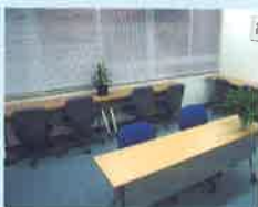
4F 自習室 Study Room

学期ごとに行われる課外授業はもちろんのこと、そのほかにも校内外のスピーチコンテストや日本文化体験(日本舞踊・茶道・書道・華道等)など、多様な行事を実施しています。