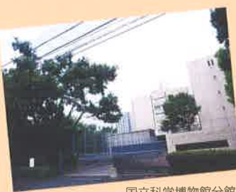
国立科学博物館分館 National Science Museum Annex