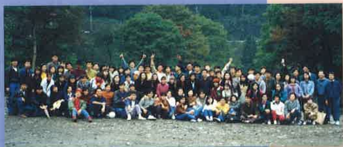
秋川溪谷 Akikawa Valley