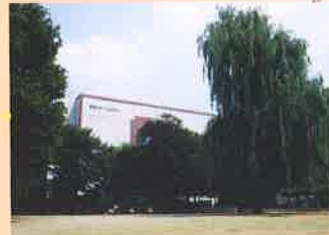
戸山公園 / Toyama Park