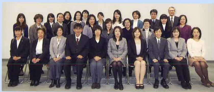
講師スタッフ / Instructors