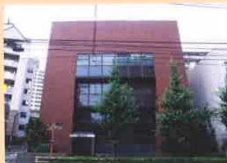
俳句文学館 Museum of Haiku Literature