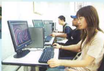
4F パソコンコーナー Personal computer corner