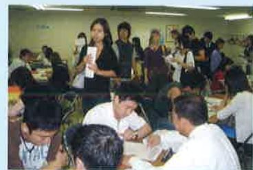
進学説明会 Orientation for further study in Japan

In addition to an extra-curricular class once a term, MCA offers various events such as a speech contest, Japanese cultural experience class (traditional dancing, tea ceremony, calligraphy, flower arrangement etc. ).