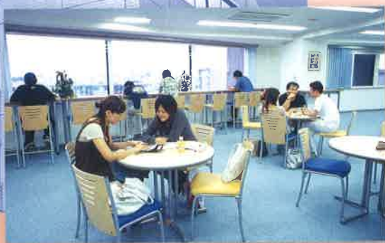
6F ラウンジ / Lounge