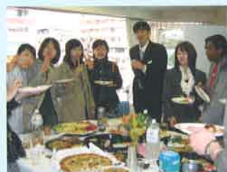
卒業パーティ Graduation party