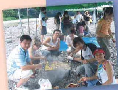
バーベキュー Barbecue party