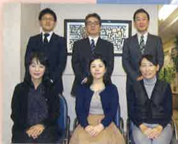
事務局スタッフ Office staff