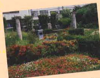
小泉八雲記念公園 Koizumi Yakumo Memorial Park