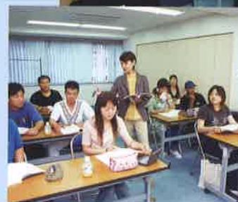
授業風景 Class Lessons