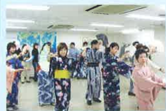
日本舞踊 Japanese dancing

日本語能力試験特別対策クラス開講 個別面接練習開始 Preparation class for Japanese Proficiency Test starts Interview practice starts