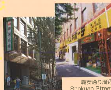
職安通り周辺 Shokuan Street