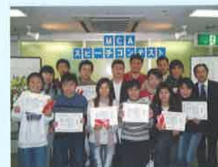
スピーチコンテスト Speech contest

第2回日本語能力試験 2nd Japanese Proficiency Test