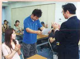
表彰 / Scholarships