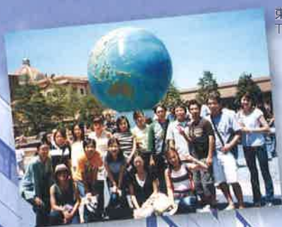
東京ディズニーシー Tokyo Disney Sea