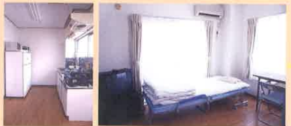
高円寺寮 / Koenji Dormitory

MCA students come from mainly Asian countries including Korea, China, Taiwan, Hong Kong, Viet Nam, and Russia, Mongolia, Nepal, Myanmar, Turkey and so on. You can meet various personalities and characters enjoying cross-cultural communication and mutual understanding.