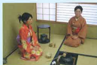
茶道 / Tea ceremony