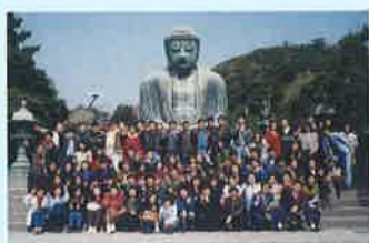
課外授業(鎌倉) Extra-curricular activity /Kamakura

第1回日本語能力試験 1st Japanese Proficiency Test