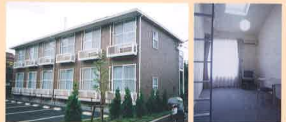
桜上水寮 / Sakurajousui Dormitory