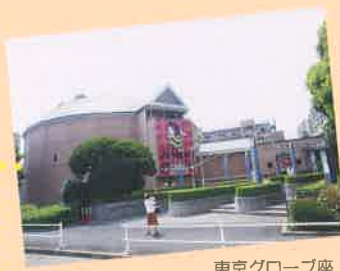
東京グローブ座 Tokyo Globe Theater